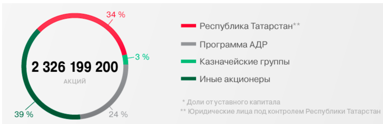
Рис. 1. Структура акционерного капитала [1]

Оптимальная структура капитала увеличивает финансовую устойчивость, текущую ликвидность и платежеспособность фирмы, в том числе увеличивает рентабельность вложенных средств. Мировая практика показывает, что если развиваться за счет основных средств, то развитие бизнеса может замедлиться. Использование собственных и заемных средств имеют свои достоинства и недостатки. Задачей выбора оптимальной структуры капитала является одной из наиболее серьезных и актуальных проблем финансового менеджмента как для российских компаний, так и для зарубежных фирм. Для начала проанализируем структуру акционерного капитала ПАО «Татнефть» в 2019 г., данные представлены на рис. 1.